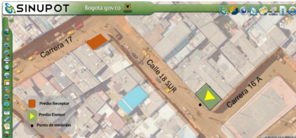
Figura 1. Ubicación del predio emisor, predio receptor (CR 17 No. 18 – 06 SUR) y punto de medición.